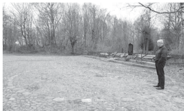
Такой сейчас центр бывшего Норденбурга.