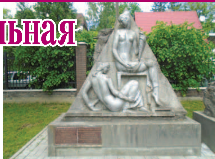
Скульптурная композиция «Ткачи» теперь находится в доме-музее Брахерта.

Последний взрыв на улице прозвучал 30 апреля 1945 года. Тогда на Арндтштрассе от взрывателя замедленного действия сработал немецкий фугас, оставленный фашистами.