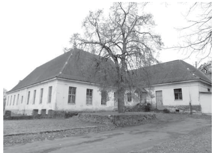
Бывшее здание суда.

На вопрос: почему такая красивая постройка заброшена? он с явной печалью отвечает, что после войны в её стенах поселилось правление колхоза имени Красной Армии. Но рухнул колхоз, а вместе с ним убралось и правление. Жаль. А сам он, кстати, трудился в этом колхозе.