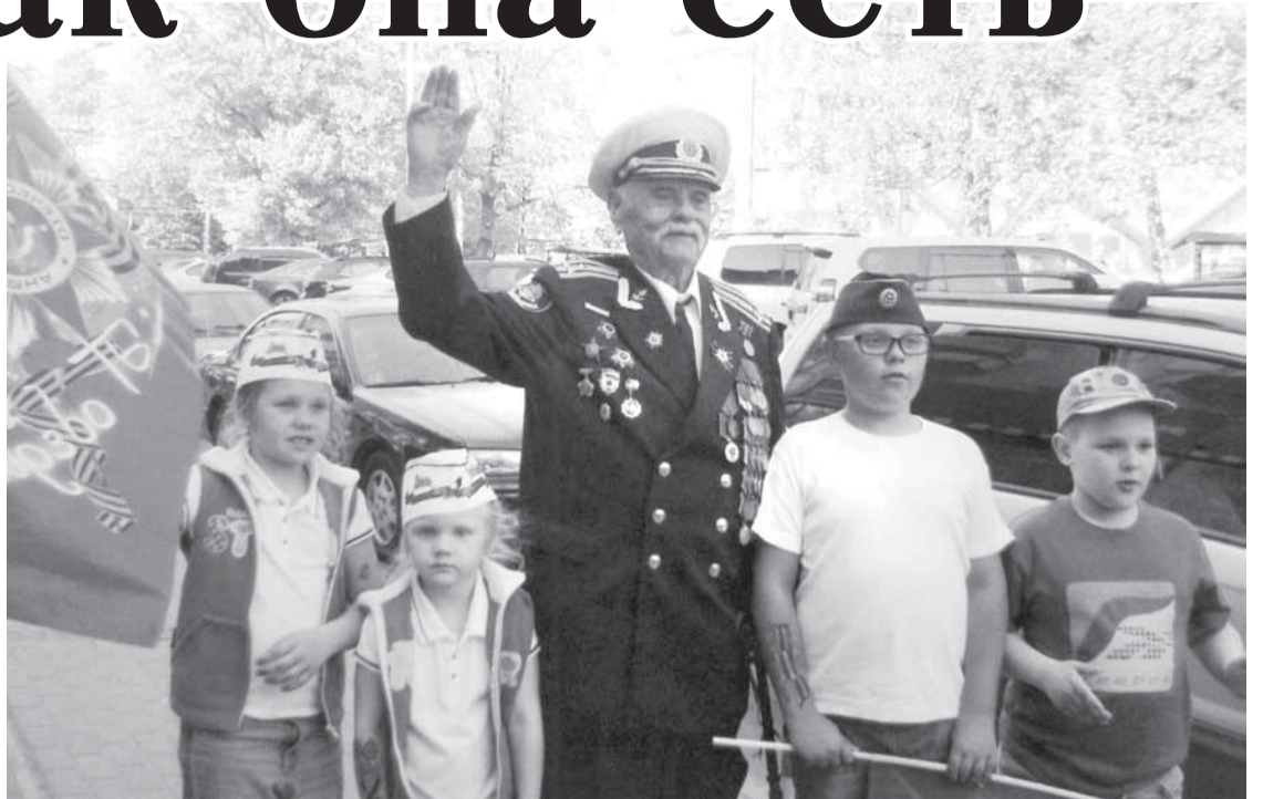
После парада 9 Мая: если дети просят вместе сфотографироваться, ветеран им не отказывает. 2017 год.

«В Рязань прибыло эшелонных десять из разных училищ — омского, алма-атинского, ашхабадского и так далее. Не успели выгрузиться, как немцы стали бомбить. Хорошо, что