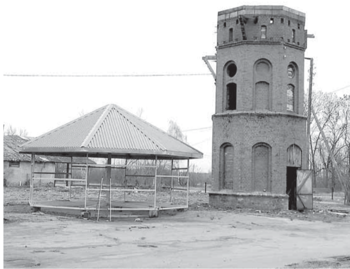
Купол башни готов к установке, а потом в самой башне обустроят краеведческий музей.

И он предложил подняться на водонапорную башню и оттуда по-