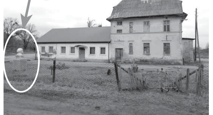
Погранпункт сторожит теперь только Ленин