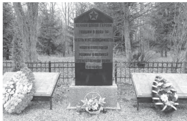
В братской могиле более 200 воинов.

Вообще Норденбургу не повезло. После войны волевым решением Кремля его территорию разделили на три части: одна досталась Советскому Союзу, другая — Польше, а между этими участками ещё образовалась и нейтральная полоса (пограничье).