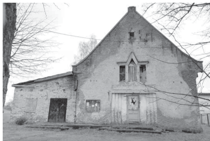
Баптистская капелла (до войны), затем поселковый Дом культуры. Сейчас здание пустует и разваливается.