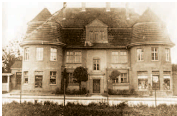
Дом №7: до войны и теперь.