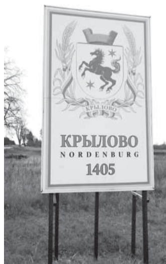
Герб Норденбурга на въезде в Крылово.

Немцы же, сделав выводы, ждать повторного набега не стали — немедленно «одели» свой «вальдхауз» в камень, восстановили посёлок, дав ему название Норденбург, что означает «Северная крепость».