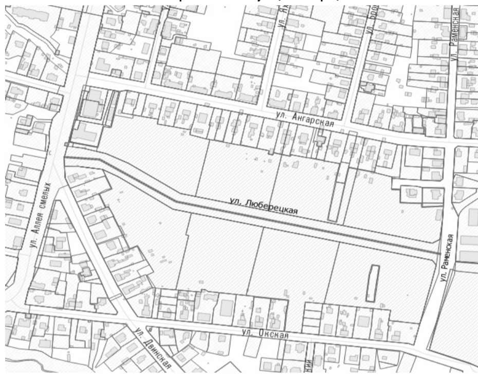
Схема расположения улицы Люберецкой

Российская Федерация Калининградская область Городской округ «Город Калининград» Городской Совет депутатов Калининграда (шестого созыва)