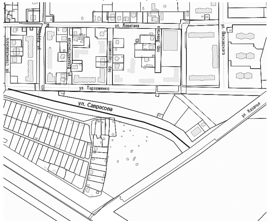
Схема расположения улицы Саврасова

Российская Федерация Калининградская область Городской округ «Город Калининград» Городской Совет депутатов Калининграда (шестого созыва)