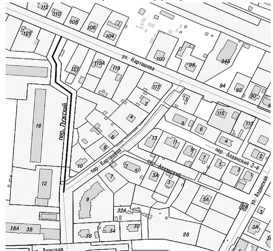
Схема расположения переулка Лужского

Приложение к решению городского Совета депутатов Калининграда от 25.11.2020 № 227