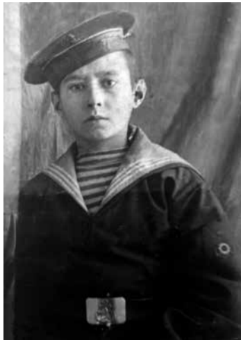
Курсант военно-морской спецшколы. 1945 год.