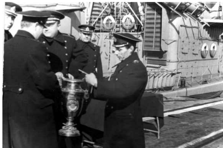
Капитан 1-го ранга Рубинштейн получает кубок за успешное преследование подводной лодки.

Поезд прибыл 22 июня в 7 утра. Не распаковывая вещей, отправились на рынок. Там из длинного уличного репродуктора услышали: «Внимание! Внимание! Говорит Москва». Так и узнали, что на страну напала Германия.