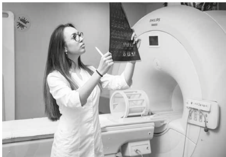
Отсутствие повреждений в лёгких не гарантирует того, что у вас нет COVID-19

Для вкуса можно добавлять немного фруктов, ягод и мяты.