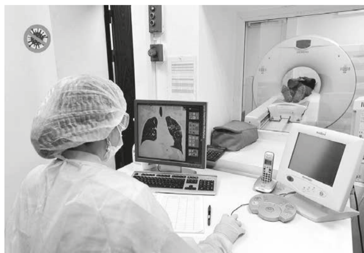
Компьютерная томография проводится для диагностики внутренних органов, а не для выявления вируса

Также необходимо организовать приём посетителей по предварительной записи, максимально использовать дистанционный формат взаимодействия с населением, не отказывая в предоставлении, оказании услуги. ■