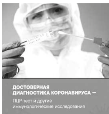
ДОСТОВЕРНАЯ ДИАГНОСТИКА КОРОНАВИРУСА — ПЦР-тест и другие иммунологические исследования

До 1 декабря вводится самоизоляция для неработающих жителей региона в возрасте 65 лет и старше, а также граждан, имеющих болезни органов дыхания (хроническая обструктивная лёгочная болезнь, бронхиальная астма), эндокринные заболевания (сахарный диабет). Находиться в самоизоляции можно по месту