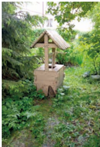
Колодец у дома №14.