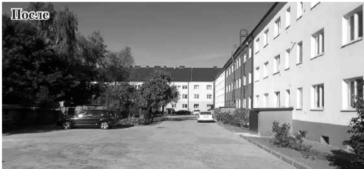
В 2020 году разительно изменился двор по улице П. Морозова, 102-108 — Печатная, 2, 4-24.