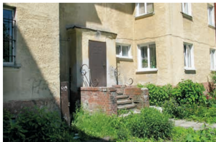
Крылечко во дворе «шахматного дома» №2-18.

года. Поэт любил её, но Лиля была замужем. И хоть супружеских отношений с мужем не поддерживала, не бросала его.