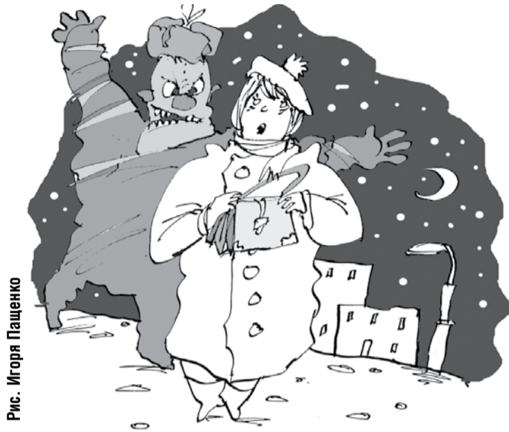
Рис. Игоря Пащенко

В посёлке Прибрежный неизвестный вырвал из рук девушки сумку, достал из неё кошелек, забрал 500 рублей, после чего вернул сумку и скрылся. Полицейским удалось задержать бандита, вскоре он предстал перед судом. Мужчина