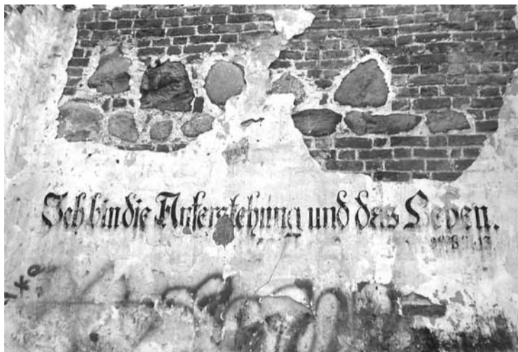
Надпись готическим шрифтом на стене башни. Внизу «автограф» вандала.

прихода в годы Первой мировой. Впрочем имена всех 76 человек, высеченные на розовом граните, разобрать ещё можно.