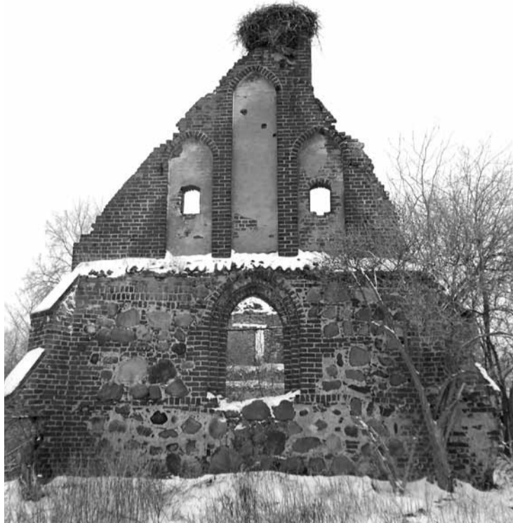
Фронтон восточного фасада кирхи с гнездом аиста наверху.

Метрах в пятидесяти от восточного фасада кирхи грудой сложены валуны — это всё, что осталось от памятника погибшим жителям