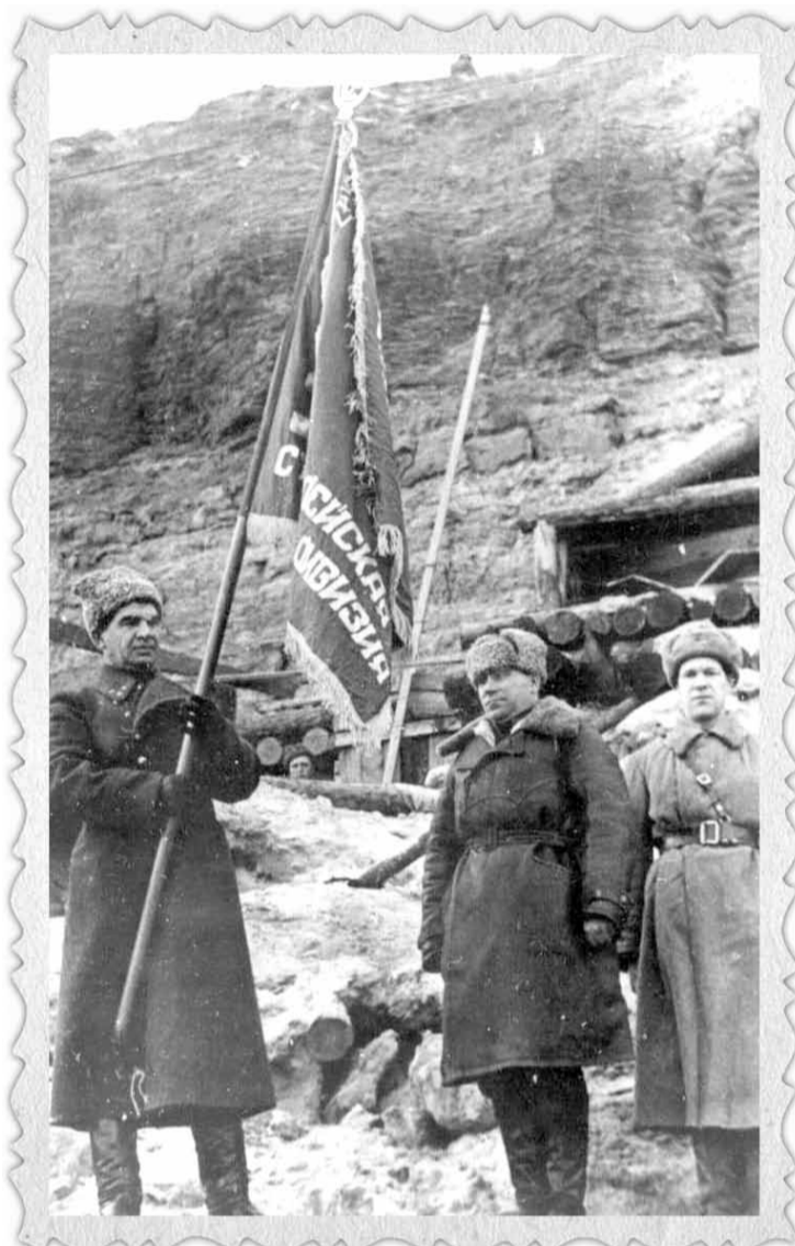
Генерал-полковник Чуйков в Сталинграде вручает командиру дивизии гвардейское знамя.

«Парторг — не только тот, кто проводит митинги, но и поднимает людей в атаку, а значит, сам идёт впереди.