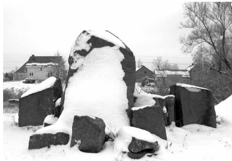
Фрагменты памятника погибшим в Первую мировую войну жителям прихода, засыпанные снегом.

Постановлением Правительства Калининградской области от 23 марта 2007 года №132 кирха в Яблонежке получила статус объекта культурного наследия регионального значения. В 2010 году её передали Калининградской епархии РПЦ. До сегодняшнего момента никаких работ по её восстановлению не велось, памятник старины продолжает разрушаться. ■