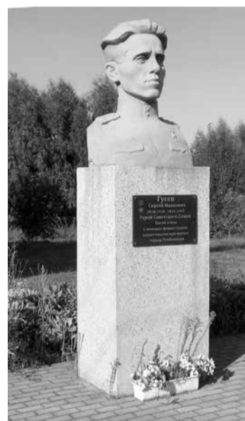
Бюст Героя Советского Союза капитана Сергея Гусева.

Русские потеряли 18839 человек, Германия - 14607.