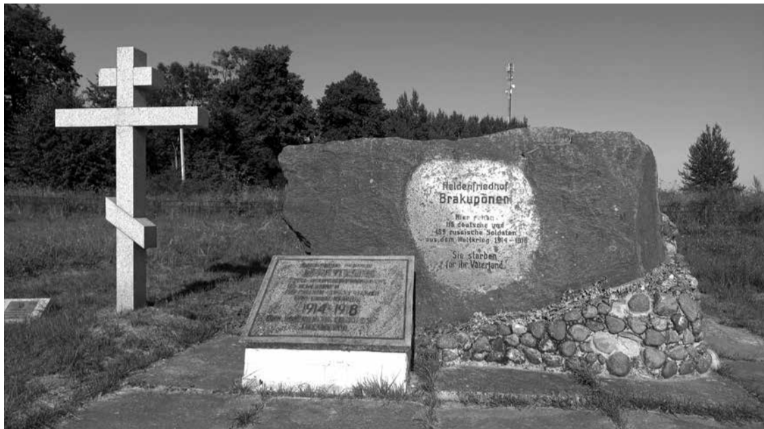
Памятник погибшим 20 августа 1914 года. Именно здесь русские герои императорской армии умерли за свободу Отечества.