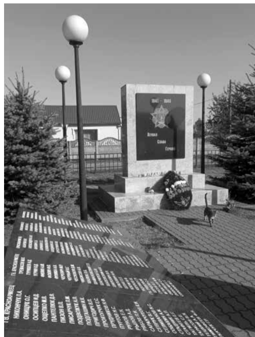
Памятник погибшим советским солдатам, взявшим Нибудшен (Красногорское Гусевского района) 19 января 1945 года. Захоронено более 350 воинов.

«Очень немногие слышали о Гумбиннене, и почти никто не оценил ту замечательную роль, которую сыграла эта победа, - сказал однажды Уинстон Черчилль, политический деятель, премьер-министр Великобритании. - Русские контратаки, тяжёлые потери Макензена вызвали в 8-й германской армии панику, она покинула поле сражения, оставив своих убитых и раненых, она признала, что была подавлена мощью России». ■