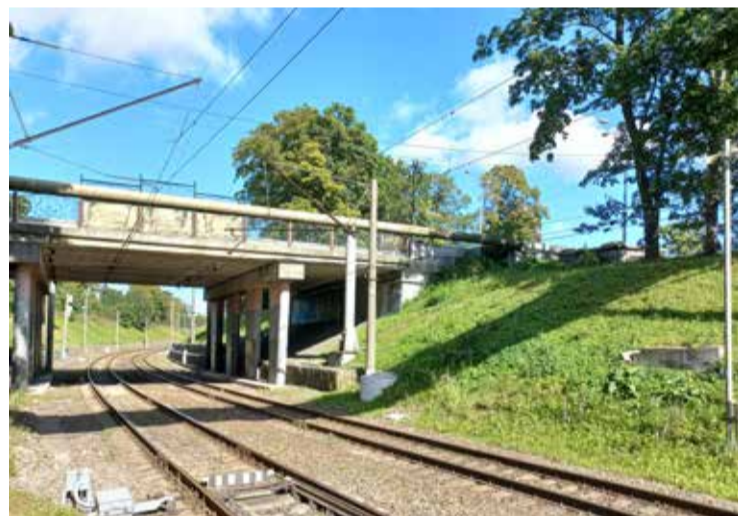
Мост на ул. Генерал-фельдмаршала Румянцева. Вдоль железнодорожных путей (слева) шла улица Erlichshausenstraße.

В отличие от своего предшественника, Конрада фон Эрлихсхауэна, кстати, он приходился Людвигу двоюродным братом, этот магистр уже не шёл ни на какие уступки прусским муниципалитетам. Чем вызывал их досаду и негодование. В итоге случилось то, что случилось. Практически все правители прусских городов ополчились на политику ордена и стали просить защиты у польско-