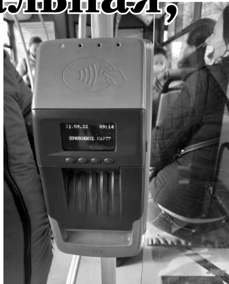
В акции платёжной системы «Мир» участвуют только виртуальные карты. Скидка в 7 рублей предоставляется при оплате через смартфон.

Во-первых, смартфон должен удовлетворять следующим требованиям: операционная система