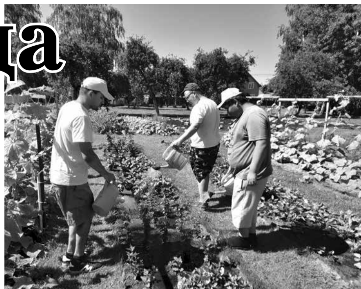
В этом году ребята из «Астарты» собрали урожай чеснока, кабачков и огурцов.

гими людьми, выясняют причины: почему они такие... И только потом идут работать в огород или сад.