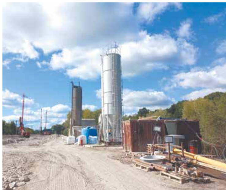
В микрорайоне идёт активное строительство подъездов к новому железнодорожному мосту через Преголю.

Скончавшегося великого магистра похоронили в Кафедральном соборе Кёнигсберга, а позже, как видим, назвали улицу в его честь. ■