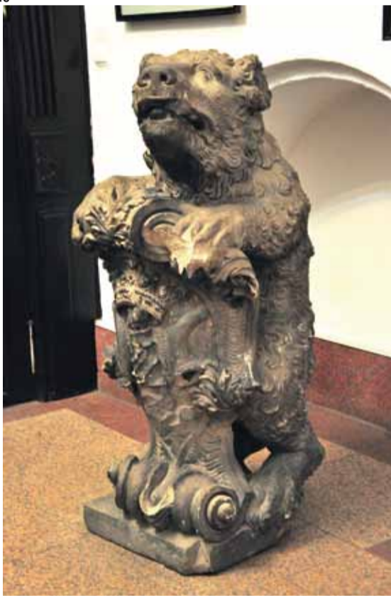
Один из медведей-щитодержателей, стоявших у ратуши Кнайпхофа.

После Второй мировой войны часть мостов Кёнигсберга была потеряна. Однако о них до сих пор напоминает знаменитая загадка математика Леонарда Эйлера, доказавшего в 1736 году, что пройти по семи мостам Кёнигсберга, не проходя ни один из них дважды — невозможно!