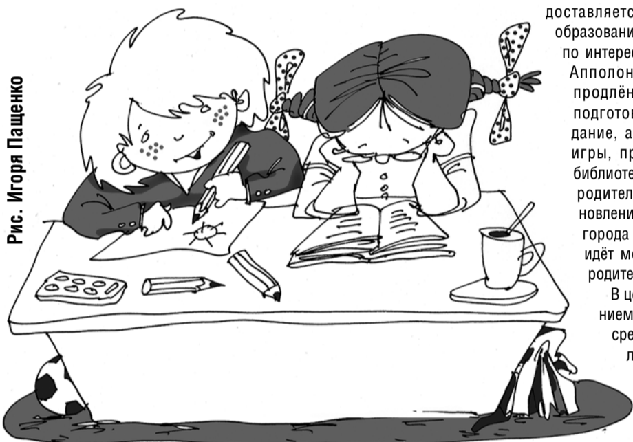
Рис. Игоря Пашенко

В целом, вместе с питанием (стоимость обеда в среднем по школам Калининграда — 52-72 рубля) посещение группы обойдётся в 1500-2000 рублей в месяц. ■